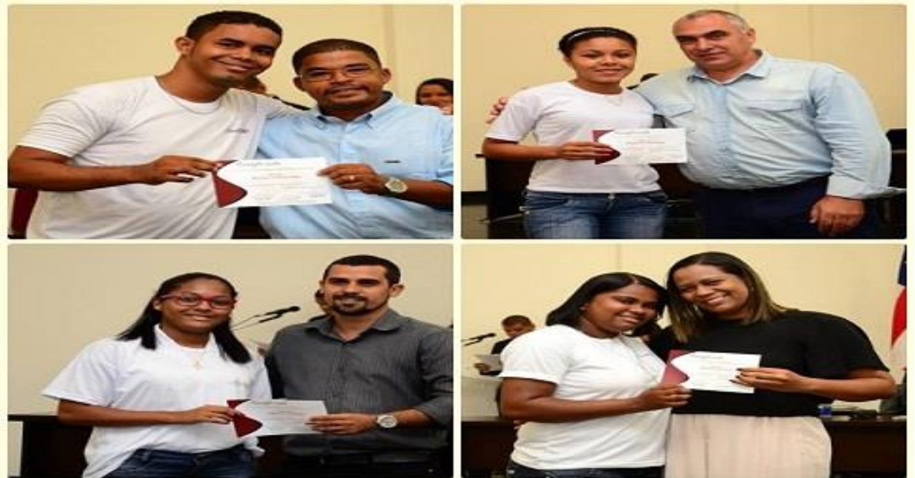
Fotos: Entrega dos Certificados.

A SEDEC iniciou o ciclo de oficinas com o tema orientação para o mercado de trabalho. As inscrições aconteceram na sede do SineBahia, localizada à Praça da Independência, entre os dias 02 e 03 de junho, das 08h30 às 14h. Foram disponibilizadas 40 vagas. A atividade foi realizada no colégio CEJAL