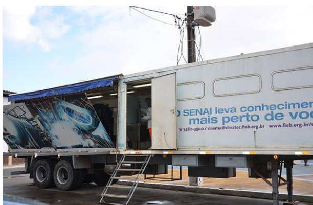
Foto: Curso de Solda.