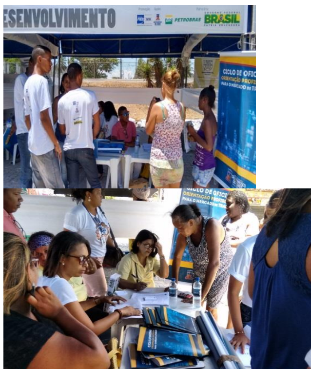
Fotos: Feira da cidadania

Participamos da feira da cidadania no Bairro do Caípe de baixo, promovida pelo PROGRAMA DE CRIANÇA da Petrobrás onde levamos orientação profissional, teste vocacional e elaboração curricular.