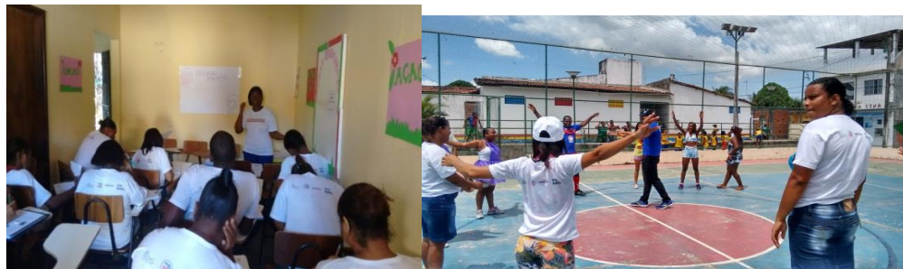
Foto: Curso de facilitador de atividades esportivas e lazer

O objetivo da atividade foi, além de testar os conhecimentos dos alunos que estão fazendo o curso, dar aos jovens do bairro um momento de diversão e lazer com atividades monitoradas por profissionais que vão orientar a diversão na quadra esportiva do bairro. O curso iniciou no dia 14 de setembro e terminou no dia 11 de novembro.