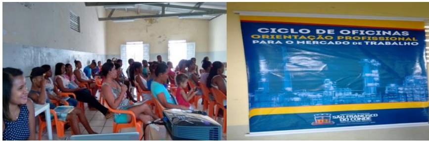
Fotos das oficinas no Socorro.

Em parceria com a Desembahia e o INSS realizamos uma palestra com o tema: “Desembahia Apresenta: Soluções Financeiras para sua Empresa”, seguida de atendimento personalizado aos comerciantes e empreendedores do município.