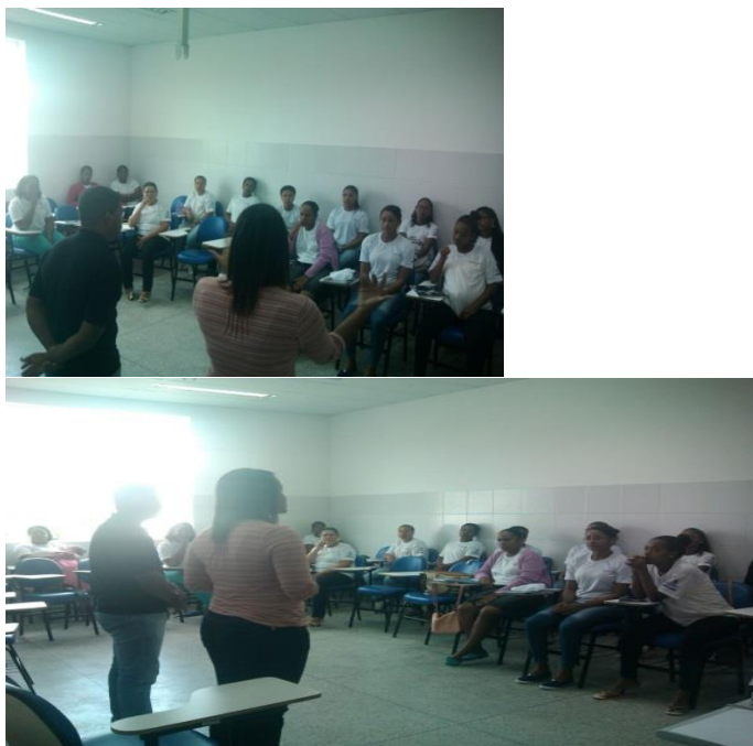
Foto: Acompanhamento Pisco profissional

Iniciamos o trabalho de acompanhamento pisco profissional, com os alunos dos cursos que foram ofertados por esta secretaria.